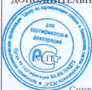
Схема сертификации - 1с